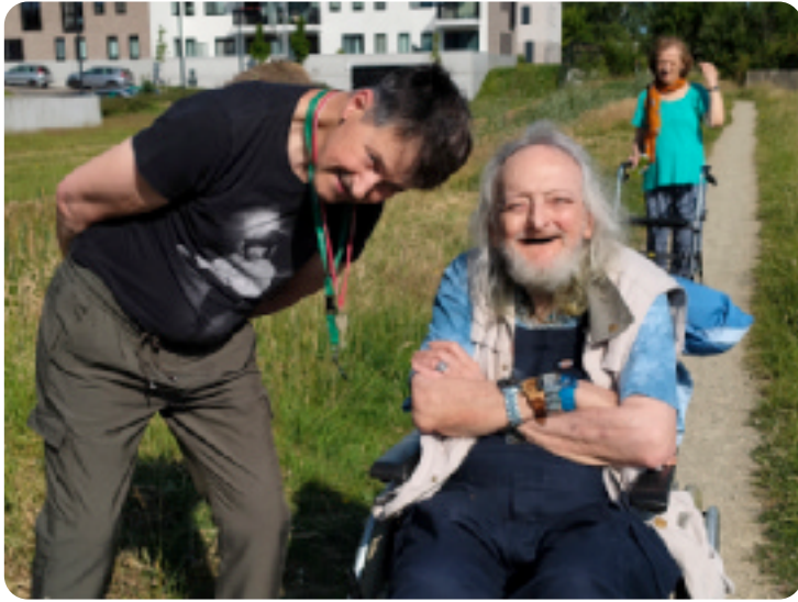
Met de Parel bezochten we de rozentuin.